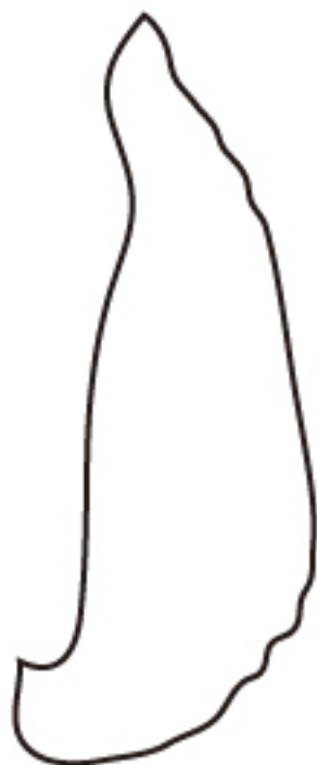
ロゼッタのお洋服