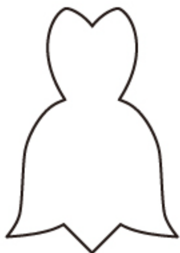
ティンカー・ベルのお洋服