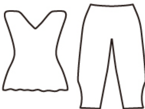
フォーンのお洋服