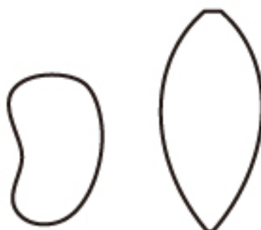
ボディピース スカートピース