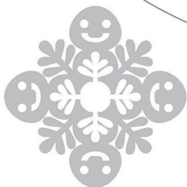
ゆき けっしょう 雪の結晶 3